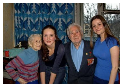
Рис. 9. Работа добровольцев с ветеранами ВОВ