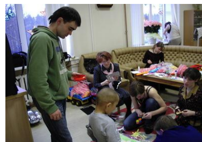
Рис. 8. Работа добровольцев в детском учреждении

Оценка менеджмента добровольческих программ происходит внутри организации — внутренняя оценка. Она производится главным образом координатором работы добровольцев и обсуждается на общих собраниях. Оценка производится и руководством организации. При этом могут использоваться количественные показатели участия добровольцев в работе организации (например, собираются статистические данные о числе добровольцев и количестве отработанных ими часов), представленные в