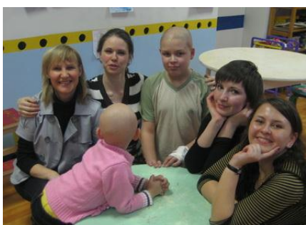
Рис. 7. Добровольцы впервые в детском учреждении для больных лейкозом

Многое в этом случае зависит от личности организатора (координатора) добровольной работы и руководителя, которые выступают от лица организации. В переговорах и общении могут возникать первые поручения и просьбы к добровольцу, которые связаны с его особенными навыками, опытом. Важно, чтобы человек почувствовал, что именно он может решить конкретную проблему или задачу, что организация считает большой удачей привлечение такого добровольца (рис. 6).