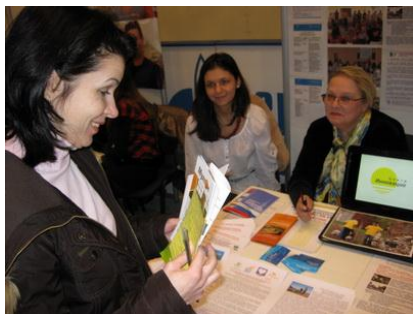
Рис. 13. Набор добровольцев на городской Ярмарке вакансий

Осуществив работу по определению и формулированию всех этих аспектов, после первой же полноценной кампании по набору добровольцев Вы увидите, какой ясной и прозрачной стала деятельность Вашей организации и для сотрудников, и для добровольцев, и для клиентов, и для партнеров, и для спонсоров.