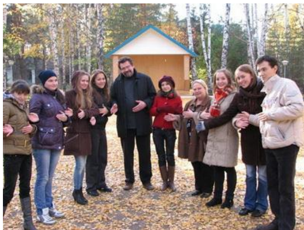
Рис. 24. Группа координаторов в образовательном лагере

Одинаково важно не нарушать сложившихся культурных традиций и не выходить за рамки имеющихся ресурсов.