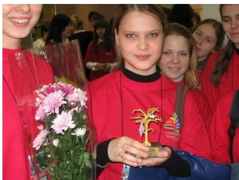
Рис. 12. Добровольцы, получившие призы

Признание и поощрение добровольцев — обязанность организации, в которой они работают. Как Ваша организация исполняет эту обязанность? Какие особые формы признания добровольной работы приняты у Вас? Как