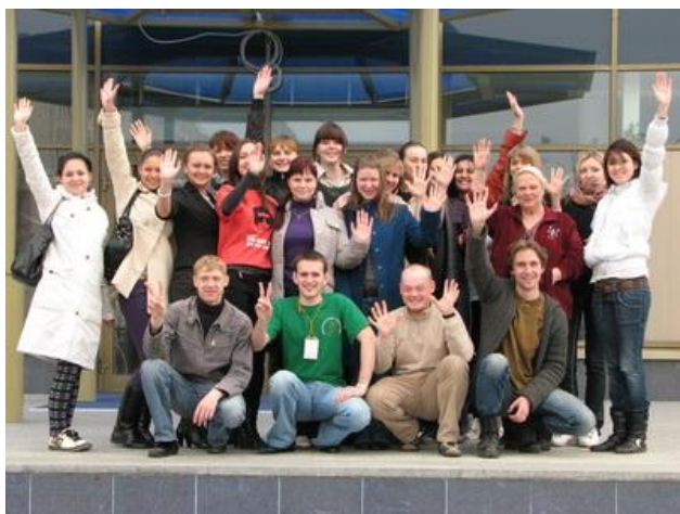
Рис. 23. Группа координаторов на стажировке

содействует практическое сотрудничество, совместные проекты, в т.ч. образовательные, взаимные стажировки (рис. 23 и 24).