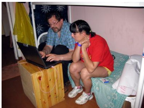
Рис. 2. Помощь эксперта добровольцу, разрабатывающему проект в выездном лагере

В любом начинании каждому человеку требуется поддержка. Для добровольца эта поддержка является опорой его работы в организации. Для организации поддержка добровольца — создание гарантий его верности целям организации и честной работы.