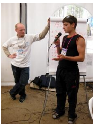
Рис. 10. Обучение молодых добровольцев в выездном лагере

Целью обучения и повышения квалификации добровольцев является подготовка их к квалифицированной и самостоятельной работе (индивидуальной или в команде) и тем самым обеспечение высокого качества оказываемых услуг, которые отвечают интересам организации и ее клиентов.