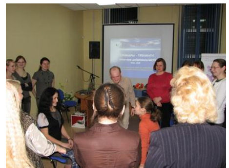
Рис. 14. Плановый обучающий семинар для действующих добровольцев

Необходимо предполагать и вовремя увидеть личные изменения у добровольца и его потребности в дополнительном обучении. Это может быть усталость, изменения в личной жизни, ослабление/изменение мотиваций, потребность в профессиональном росте, изменение сферы ответственности в организации и др. Плановые периодические обучающие мероприятия являются одновременно и методом профилактики «охлаждения» и ухода добровольцев, и методом своевременного выявления проблем у добровольцев (рис. 14).