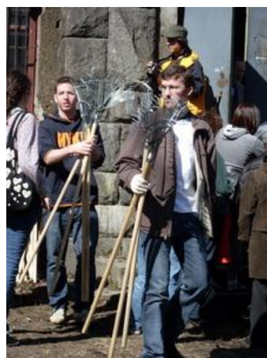
Рис. 17. Свои обязанности в период проведения акций добровольцы определили сами

Испытательный срок/период дает обеим сторонам возможность разобраться в том, адекватна ли задача, поставленная добровольцу его возможностям, как могут быть решены возникающие проблемы. Этот период