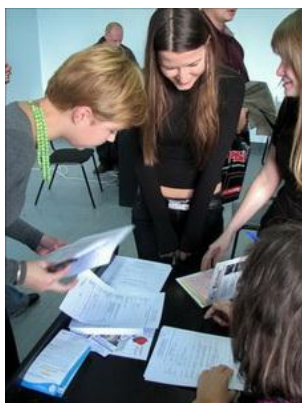
Рис. 20. Формирование раздаточных материалов к собранию добровольцев

Что необходимо узнать новому добровольцу о Вашей организации? Как помочь добровольцу разобраться в целях, задачах и методах, в программах и проектах Вашей организации, в ее правилах и стандартах работы, в том, кто и за что отвечает? При этом и Вам, и добровольцу необходимо выбрать наиболее подходящую для него сферу активности. Прежде всего необходимо сформировать раздаточные материалы для добровольцев (рис. 20), но помнить, что как недостаточность информации, так и информационный шквал могут оттолкнуть нового