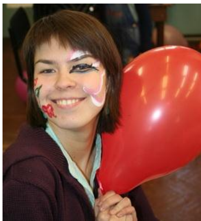
Рис. 18. Координатор добровольцев, имеющий явные артистические способности

Главная задача координатора работы добровольцев состоит в планировании, координации и совершенствовании процесса менеджмента добровольческих программ. Как правило, координация работы добровольцев требует особых способностей и квалификации.