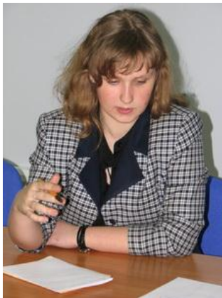
Рис. 6. Молодой доброволец решает задачу, поставленную организацией

3. Третья группа методов мотивирования опирается на особенности самого добровольца (личностные, профессиональные, имеющийся опыт). Человек хочет быть исключительным и неповторимым. Нужно дать ему это почувствовать и предоставить возможность реализовать именно ему свойственные способности.