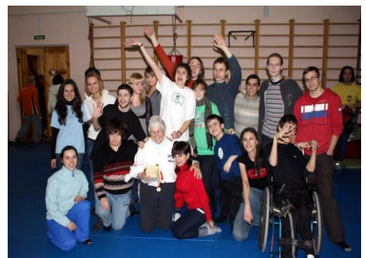
Рис. 20. Координаторы добровольцев, работающих в среде людей с инвалидностью

Организатор/координатор по работе с добровольцами, безусловно,