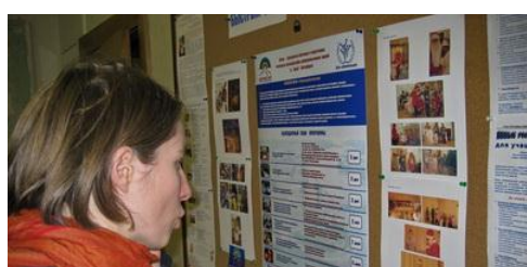
Рис. 23. Наглядная информация для добровольцев в офисе НКО

штурмы, презентации новых программ и проектов, демонстрация видеоматериалов — все эти методы эффективны для того, чтобы Ваши добровольцы были в курсе дел.