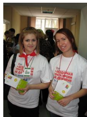
Рис. 5. Работа добровольцев на станции переливания крови

Работа добровольцев должна постоянно контролироваться. Для каждого человека важно, чтобы его работу замечали. Для каждой организации важно, чтобы люди, работающие в ней, двигались к общей цели, а не в разные стороны. В этом поможет организация системы учета добровольной работы, использование методов осуществления мониторинга и разработка критериев оценки эффективности как работы добровольцев, так и работы с добровольцами.