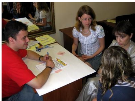
Рис. 1. Мотивирующая беседа координатора с новыми добровольцами организаций является совпадением их мотивирующих аргументов организации с мотивами добровольцев. Но как всякая удача, она не может быть запланирована. Зачастую требуется приложить много усилий для того, чтобы получить от работы добровольца результат, необходимый организации.