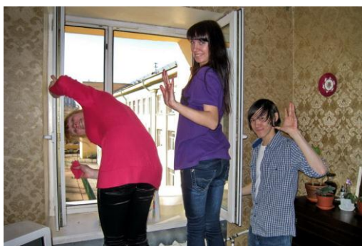
Рис. 15. Добровольцы моют окна на дому у пожилых людей в период Весенней недели добра-2009

Четкое определение круга задач и обязанностей позволяет использовать труд добровольцев как на пользу им самим, так и на пользу организации. При определении круга текущих задач на первом месте стоит мотивация самого добровольца. Он должен иметь возможность получать радость от работы, завязывать личные контакты, учиться новому. Необходимо исключать факторы,