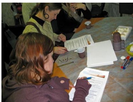
Рис. 17. Анкетирование добровольцев

Как выявлять мотивы пришедших к Вам добровольцев? Нужно ли их выявлять?