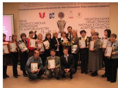
Рис. 14. Победители конкурса «Национальная общественная награда в области добровольчества»

Признание работы добровольцев в организации нельзя рассматривать вне социального контекста и государственной социальной политики. Все большее значение приобретает признание добровольческой деятельности государством. Поэтому организация, использующая труд добровольцев, обязана заботиться и о стимулировании, и о поощрении добровольцев со стороны государства и общества.