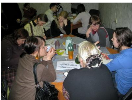
Рис. 5. Координаторы НКО определяют проблемы вместе с добровольцами

Приглашайте новых добровольцев на мероприятия, где Ваша организация обязательно будет выгодно выглядеть, например, заключительные совещания со спонсорами, органами власти, партнерскими НКО (когда разговор не начинается, а завершается получением организацией дополнительных ресурсов, преференций для дальнейшей деятельности). Включайте новых добровольцев в отчетные и итоговые мероприятия, чтобы добровольцы увидели реальные результаты и достижения, стали очевидцами прямой или косвенной оценки деятельности Вашей организации (рис. 4).