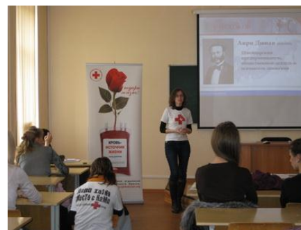
Рис. 10. Презентация добровольческой программы в вузе

Привлекая людей к работе в Вашей организации, Вам необходимо не только ясно и понятно объяснять, для какой конкретной работы нужны добровольные помощники, но прежде всего объяснять цели этой работы. Кому поможет то, что Вы намерены делать с помощью добровольцев? Участниками каких общественных