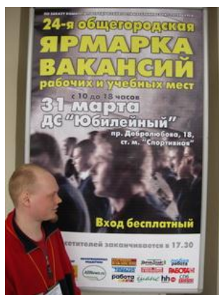
Рис. 12. Набор добровольцев на городской Ярмарке вакансий

Кампания по набору добровольцев — это ответственное событие на этапе старта любой добровольческой программы, проекта, акции. Основные шаги кампания по набору добровольцев: