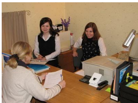
Рис. 19. Доброволец, прошедший отбор