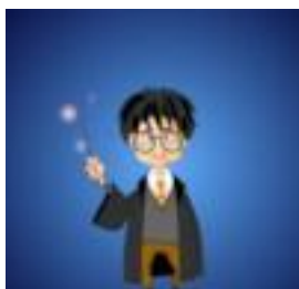
Рис. 22. Иногда координатор — это настоящий волшебник!

Как руководитель работы с добровольцами Вы хотите, чтобы они работали как можно более эффективно, чтобы добровольческий коллектив был сплоченным. В идеале Вы представляете себе добровольца, преданного интересам организации, ее росту, делающего все возможное для ее успеха. Все это достижимо при условии, если Вы сами приложите максимум усилий.