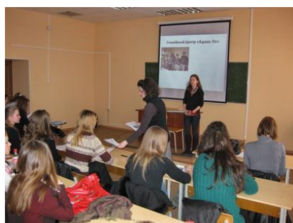
Рис. 9. Презентация добровольческой программы в вузе

При выборе формы «широкое привлечение» молодых добровольцев используйте метод презентаций добровольческих программ в учебных заведениях (рис. 9, 10, 11).