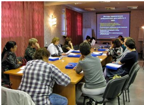
Рис. 4. В итоговом семинаре проекта участвуют добровольцы

обеспеченные, не пользовались устойчивой общественной и добровольческой поддержкой. То же может случиться и с Вами, если Вы не сможете доказать добровольцам реальность поставленных целей и реальность их достижения. В этом очень хорошо поможет рассказ об истории организации, о ее успехах и неудачах. Если это сделает руководитель организации или ее признанный лидер, то это только повысит имидж организации в глазах добровольца, который почувствует правду, а также внимание и доверие к себе.