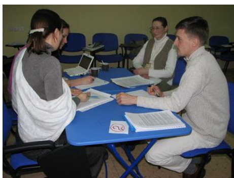
Рис. 9. Добровольцы оформляют соглашение с организацией

Взаимные права и ответственность организации и добровольца закрепляются в соглашении, имеющем характер гражданского договора (рис. 9). Такое соглашение способствует успешному сотрудничеству добровольца и организации, способствует предотвращению конфликтов. Кроме того, в соглашении определяются обязанности добровольца, график его работы, переданное для работы имущество и пр. Форма соглашения может быть любая (различные формы договоров можно найти сети Интернет). Вы можете разработать ее сами, можете использовать уже действующие в общественных организациях договоры и соглашения с добровольцами. Важно, чтобы этот документ отражал все то, что полезно именно для Вашей организации, был достаточно прост, понятен и лаконичен, а также соответствовал требованиям законодательства в области добровольчества. Составляя соглашение с добровольцем, важно не выстраивать глухую защиту организации от возможных посягательств добровольца, а определить правила взаимодействия и сотрудничества.