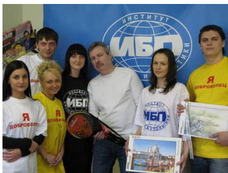
Рис. 11. Команда преподавателей и добровольцев-организаторов вуза

Тревогу вызывает следующее высказывание добровольца: «Я всего лишь доброволец». Оно свидетельствует о том, что в такой организации добровольцы чувствуют себя лишь малоценными помощниками. Тогда как добровольцы и штатные сотрудники должны рассматриваться как равные.