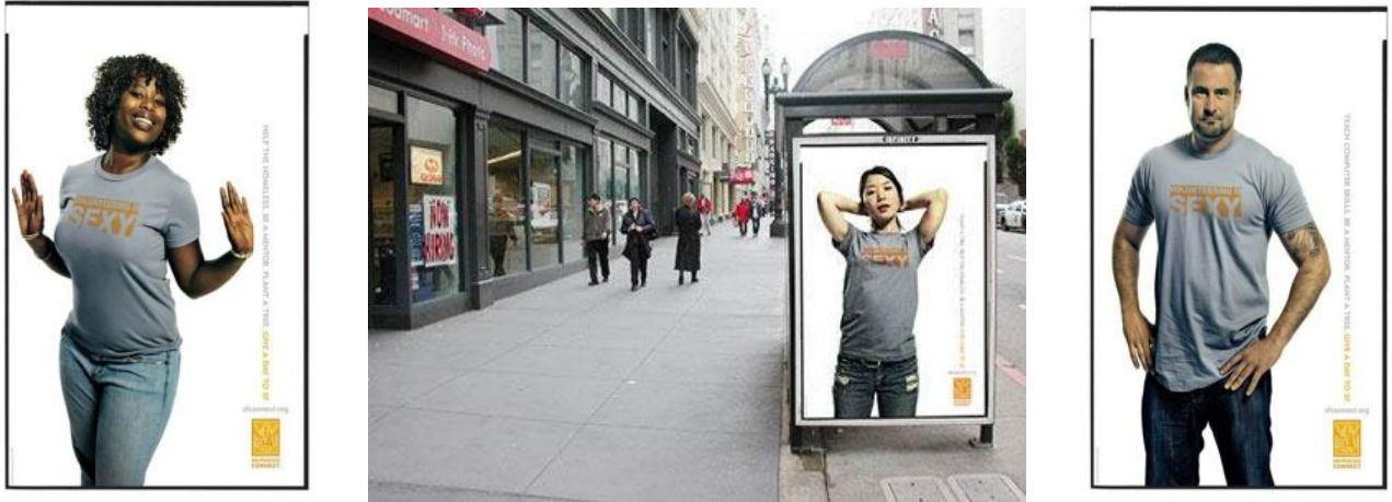
Рис. 16. Уличные постеры в Сан-Франциско с необычной рекламой добровольчества

Успешная кампания по набору добровольцев не гарантирует того, что пришедшие добровольцы долго будут работать в Вашей организации. Чтобы обеспечить гарантии работы добровольцев длительное время,