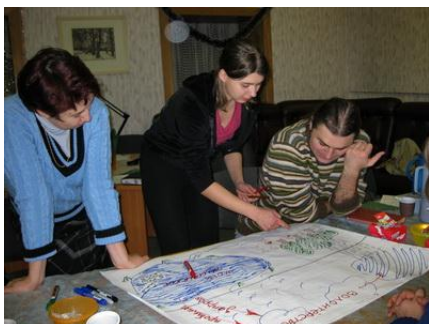
Рис. 8. Добровольцы задумывают новый проект

4. Наконец, следует использовать методы мотивирования добровольцев для работы в команде. Это могут быть специальные мероприятия в форме групповых тренингов, целью которых является развитие доверия, общего видения, коммуникативных навыков, делового взаимодействия, групповых ценностей и групповой сплоченности, знакомство с клиентами и подопечными, разработка новых проектов (рис. 7 и 8).