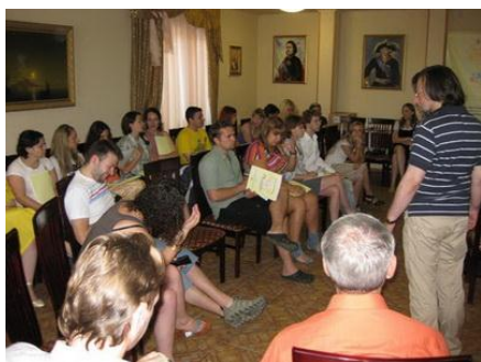
Рис. 2. Подготовка персонала к приходу добровольцев в сетевой благотворительной организации

Продуманная подготовка персонала поможет минимизировать конфликты и повысить эффективность работы добровольцев в организации. Эту функцию целесообразно закрепить за координатором по работе с добровольцами. Важно, чтобы руководитель и основные лидеры/менеджеры организации были его помощниками в этой подготовке (рис. 2).