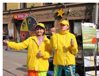
Рис. 7. Работа добровольцев на улицах города

Сводки или отчеты о работе, наблюдения координаторов-добровольцев, обсуждения на собраниях — все это поможет контролю. Однако наиболее эффективна обратная связь с самим добровольцем. Есть ли у него трудности, нужно ли что-либо дополнительное для клиентов Вашей организации, с которыми он работает? Возможно, он устал или хочет изменить вид деятельности, пройти дополнительное обучение или реализовать новую идею? Как Вы узнаете об этом, если в Вашей организации работают 200