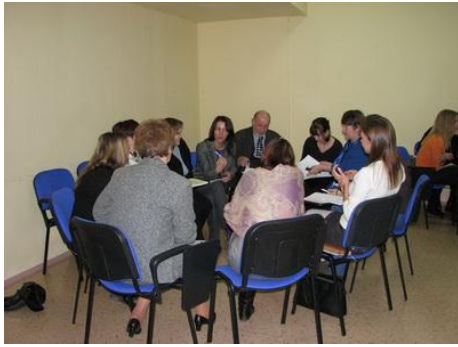
Рис. 3. «Мозговой штурм» в процессе планирования добровольческих работ

Планирование при работе с добровольцами — важнейший элемент работы, придающий устойчивость организации в области управления человеческими ресурсами. По сути, планирование добровольческих работ — это фундамент, на