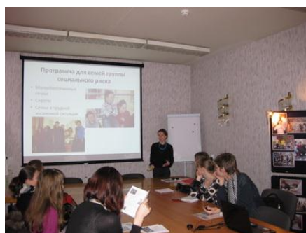
Рис. 11. Презентация добровольческой программы в вузе