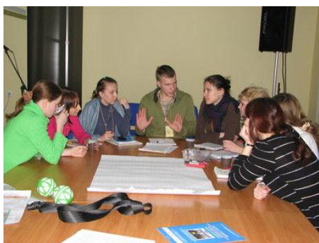
Рис. 13. Работа в малой группе на семинаре для добровольцев

Выдержка из рекомендаций для координаторов работы добровольцев и штатных сотрудников: «Они (добровольцы) могут многое предложить сами, и обучение может быть увлекательным процессом для всех участников».