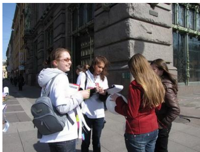
Рис. 8. Набор добровольцев на улицах города

Где и как искать добровольцев? Дать заметку в местную газету? Или развернуть широкую рекламную кампанию в СМИ? Может быть, стоит обратиться к клиентам, партнерам, друзьям, родственникам? Может быть, обратиться в дружественные организации? Может быть, поговорить с прохожими на улице (рис. 8)?