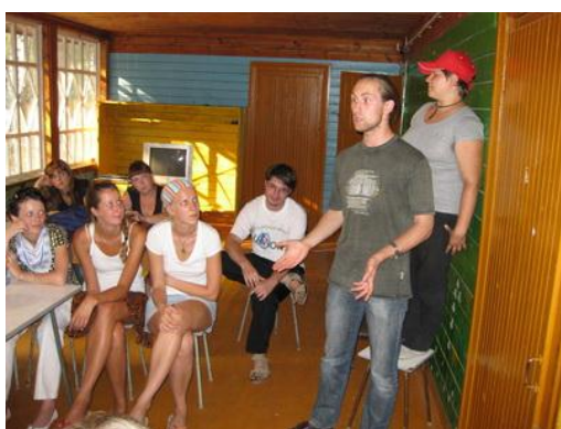
Рис. 3. «Разбор полетов» в выездном лагере

Одним из эффективных методов поддержки добровольцев является наставничество, помощь опытных сотрудников, экспертов. Поддержка известных людей, общественных лидеров придает добровольцам уверенность в своих силах, дает понимание значимости их работы, идей и начинаний для общества (рис. 2).