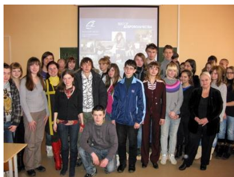
Рис. 3. После презентации известного социально значимого проекта в вузе

Подобные схемы и алгоритмы, безусловно, помогают нам осознать, как мотивировать людей. Но на практике мотивирование новых добровольцев — это сложный процесс, который требует от лидеров НКО большего, чем понимание алгоритмов, таких как «потребности – мотивы – методы мотивирования».