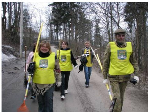
Рис. 16. Свои обязанности в период проведения акций добровольцы определили сами

Мотивированному, подготовленному и обученному добровольцу легче делегировать полномочия. Однако какие полномочия можно доверить добровольцу?