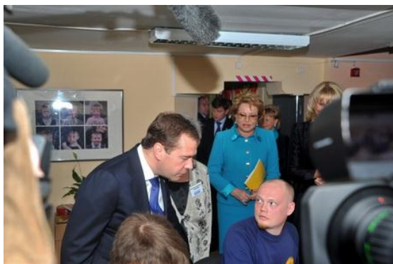
Рис. 21. Президент РФ Дмитрий Медведев вникает в работу координатора добровольцев

В Российской Федерации возрастает потребность в квалифицированных кадрах для организации добровольной работы. Для подготовки и повышения квалификации координаторов по работе с добровольцами реализуются разнообразные образовательные и тренинговые программы.