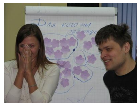
Рис. 2. Мотивирование в ходе обучения

Процесс мотивирования не всегда требует специальных форм и мероприятий. Если организация заинтересована в