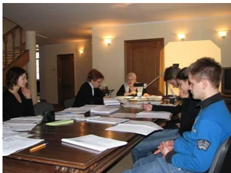
Рис. 6. Процесс определения обязанностей добровольцев в форме семинара

Важно увидеть общие цели и задачи персонала и добровольцев. Это цели и задачи самой организации (рис. 6).