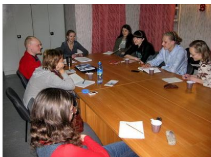
Рис. 24. Групповое ориентирование добровольцев

Как правило, попадая в новое рабочее окружение, человек чувствует себя не очень комфортно. Организация может свести к минимуму этот дискомфорт, применяя определенные формы и методы ориентирования.