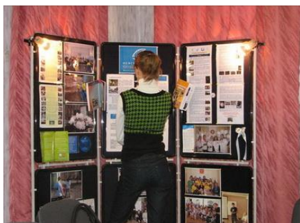
Рис. 21. Базовая информация об организации на стенде в конференц-зале

При этом должна существовать базовая информация, которая необходима всем группам добровольцев (рис. 21). Например, Миссия организации. Целесообразно формировать