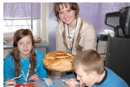
Рис. 6. Работа добровольцев в детском доме. Пасхальная неделя

Каждой добровольческой организации необходимо разработать свою систему наблюдения, контроля и оценки работы добровольцев. Организуйте систему учета добровольческой работы, рабочего времени добровольцев. Следите, чтобы каждый доброволец был закреплен за определенной сферой деятельности, программой, проектом, акцией.