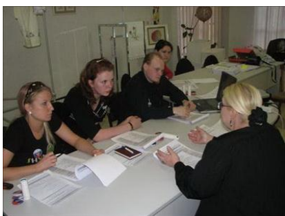
Рис. 1. Выработка политики работы с добровольцами в НКО

Прежде всего выработайте политику работы с добровольцами в Вашей организации (рис. 1).