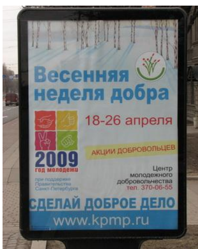
Рис. 15. Уличный рекламный постер Весенней недели добра

Ваше ключевое послание (обращение) может быть представлено в радиопередаче или телевизионной программе, в письмах, которые Вы разошлете в разные организации или разложите в почтовые ящики жителей. Оно может быть размещено в газетах и журналах, на сайтах и в рекламной продукции бизнес-компаний, на плакатах и уличных постерах (рис. 15). Вы можете также провести пресс-конференцию, и тогда сразу несколько изданий даст информацию о том, что Ваша организация объявляет набор добровольцев.