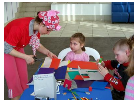
Рис. 4. Работа добровольца в детском доме

Осуществление поддержки добровольцев и их удержание в организации — это важный и ответственный элемент работы с добровольцами и профилактики синдрома эмоционального выгорания. Для этой работы необходимо планировать не только время координатора, но и время других членов штатного персонала и основной команды. Учтите это при планировании, в том числе финансовом.