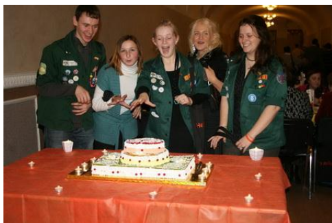
Рис. 13. Праздничный торт для добровольцев. Международный день добровольцев, 5 декабря

самостоятельно, берут на себя ответственность, участвуют в принятии решений и рассматриваются как равноправные партнеры штатных сотрудников.