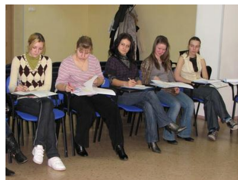
Рис. 11. Специальный обучающий семинар для добровольцев нескольких НКО

гибко создавать малые и большие, индивидуальные и групповые программы подготовки и обучения для добровольцев. В первую очередь такие программы должны быть связаны с включением добровольцев в Миссию и содержание деятельности организации; необходимо разьяснять цели, задачи, направления и методы работы, критерии, нормы, правила. Далее доброволец должен быть подготовлен/обучен оказанию услуг или помощи (если это входит в его обязанности). Если требуется специальная подготовка, которую не может осуществить организация (ведение специальных баз данных, организация библиотеки, фандрайзинг и PR), то ее задачей становится ориентация на коммерческом и некоммерческом рынках образовательных, тренинговых и консультационных услуг.