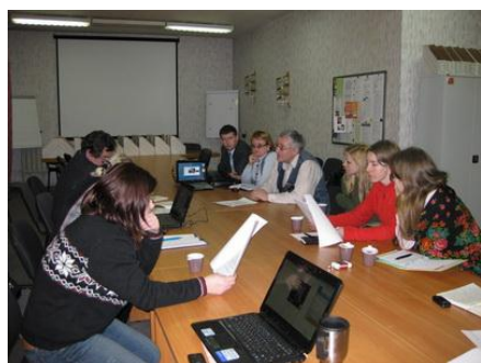
Рис. 10. Анализ проблематики в среде добровольцев

Совершенно не обязательно весь год считать все эти цифры. Но если Вы возьмете за основу несколько параметров, которые Ваша организация считает важными, Вы получите полезную статистику.