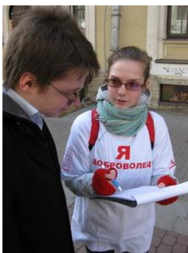
Рис. 14. Набор добровольцев на улицах города

Вовлекая людей в добровольную работу, необходимо декларировать ее смысл, ценности, цели, особенности и возможности. Помните! Люди заняты своими делами, проблемами, интересами! Что и как Вы должны сказать им, чтобы они предпочли Ваши интересы своим? Ясность в формулировании целей, задач, методов работы и планов способствует четкому изложению правил и критериев в рекламной и информационной продукции для привлечения добровольцев. Ясность формулировок помогает людям, осуществляющим вовлечение добровольцев в