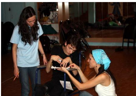
Рис. 19. Координаторы добровольцев, работающих в среде людей с инвалидностью

Кроме этого, организация добровольной работы в НКО — это та область работы, где непременно потребуются труд души! Особенно заметна эта потребность в добровольческой деятельности, направленной на помощь людям с ограниченными возможностями (рис. 19 и 20).