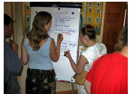
Рис. 4. Фиксация результатов по итогам «мозгового штурма»

Результатом этой работы может стать текущий, или перспективный «Перечень добровольческих работ», в который Вы занесете все виды работ, которые возможно поручать добровольцам. Раздайте этот документ