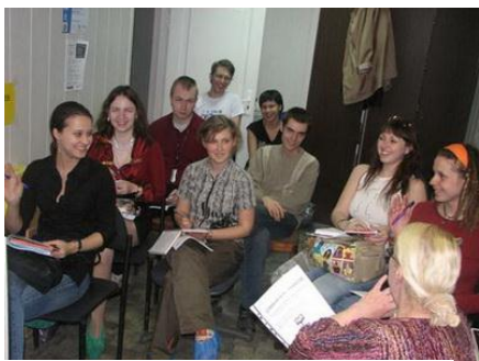
Рис. 5. Процесс планирования в молодежной организации завершен

сотрудникам выяснить свои ожидания от работы добровольцев. Она дает возможность заранее устранить неясности и проблемы.