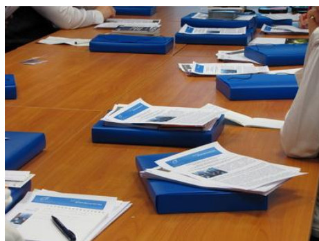
Рис. 22. Раздаточные материалы для участников обучающего семинара

По мере предоставления добровольцам информации ориентируйте их на тот или иной вид деятельности, на возможности проходить обучение, на новые перспективы работы, на возможность работы в других организациях.