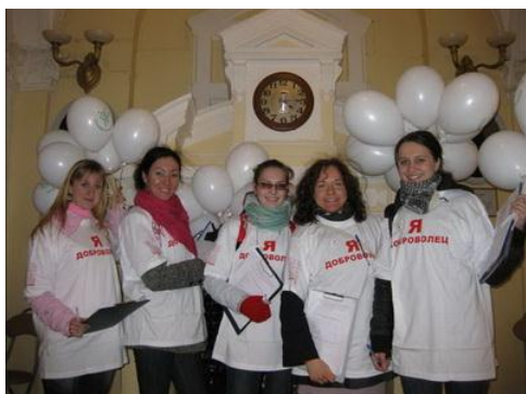
Рис. 1. Группа студентов-добровольцев, проводящих ежегодные уличные опросы молодежи по вопросам добровольчества

Работать с постоянно меняющейся группой людей необыкновенно сложно. Все мы стремимся к тому, чтобы добровольцы работали в наших организациях как можно дольше. Особенно когда мы уже много вложили сил и средств в их привлечение, подготовку и обучение.