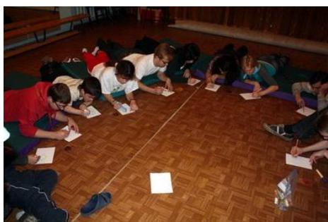
Рис. 7. Описание добровольческих вакансий в форме деловой игры

Почему и для чего необходимо формулировать и описывать добровольческие вакансии и почему это необходимо? Описание добровольческих вакансий поможет Вам уверенно проводить кампанию по набору добровольцев. Например, размещать информацию в учебных заведениях, проводить конкурсы, направлять заявки на добровольческие ресурсы в добровольческий центр или агентство, участвовать в ярмарках добровольческих вакансий, проводить выступления и презентации, работать со СМИ и т.д.).