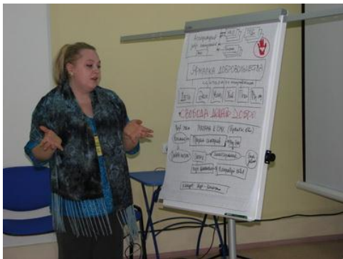
Рис. 12. Доброволец-специалист, преподаватель ИНЖЕКОН, проводит тренинг для новых добровольцев

Поэтому обучение добровольцев является эффективным методом и мотивирования, и удержания, и поощрения, и продвижения добровольцев. Если Ваша организация поддерживает отношения с «бывшими добровольцами», которые уже стали профессионалами, если они продолжают поддерживать организацию, то среди них всегда найдутся специалисты для проведения обучающих мероприятий. Наверняка среди этих людей есть преподаватели высшей школы, бизнесмены, чиновники. Привлекайте таких специалистов (рис. 12).