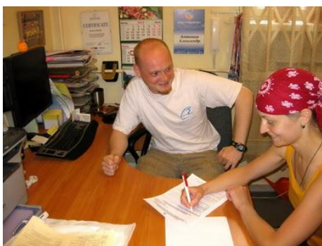
Рис. 18. Индивидуальное собеседование с добровольцем

Любой отбор добровольцев начинается с собеседования (рис. 18). Форма собеседования может быть индивидуальная и групповая. Для отбора добровольцев можно использовать и другие способы: наведение справок, просьба представить рекомендации, проба в работе и др.