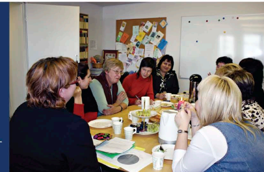
Фото 2: Встреча в Многокультурном центре

Дополнительная информация: сайт центра www.mpspkeskus.fi