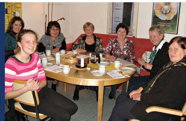
Фото 6: Встреча в CIF прошла в теплой атмосфере