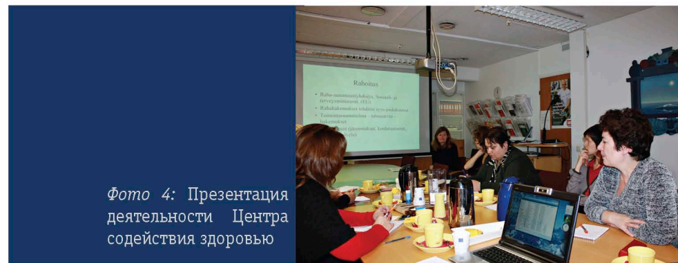
Фото 4: Презентация деятельности Центра содействия здоровью

Дополнительная информация: сайт центра www.tekry.fi