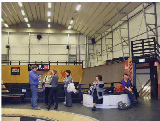
Фото 5: Зал для спортивных занятий, Фрисхусет

Финансовые условия поездок: участник оплачивает дорогу, страховку, покрывающую весь период пребывания. CIF оплачивает проживание. Участие в программе предполагает полную вовлеченность, поэтому родствен-