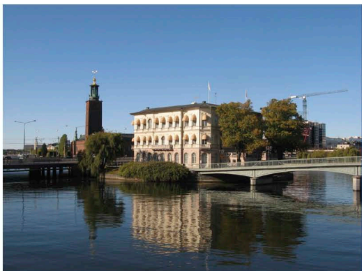
Фото 1: Стокгольм. Здание, в котором расположен офис Партнерства Северного Измерения

Визиты: негосударственные организации Финляндии и Швеции