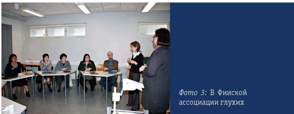
Фото 3: В Финской ассоциации глухих